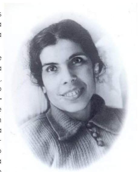
Beata Alexandrina Messaggera di Gesù